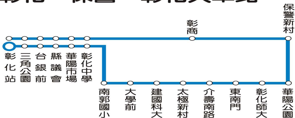
彰化市區公車 2路 彰化→保警→彰化火車站