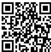
聯合國永續發展目標(SDGs)